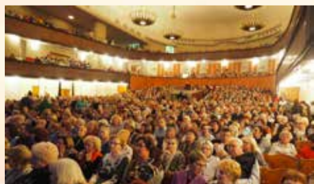
В ДК Ленсовета состоялся концерт в честь дня пожилых людей