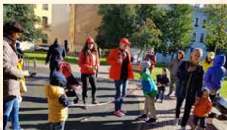
В Петроградском районе прошла акция «Твой двор»