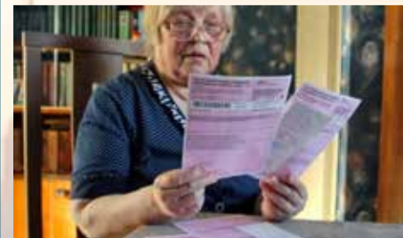
Петербуржцам сохраняют пенсионные льготы