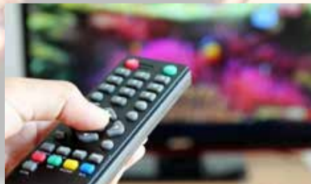
Цифровое эфирное телевидение – для больших городов